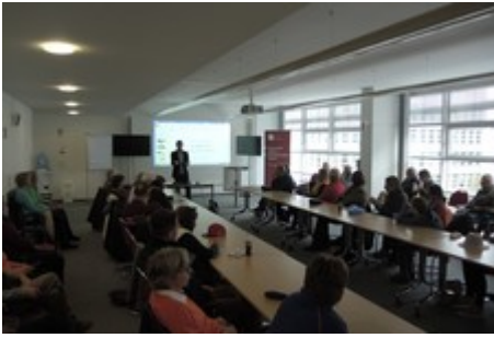
Informationsgespräch in der Bundeszentrale für politische Bildung