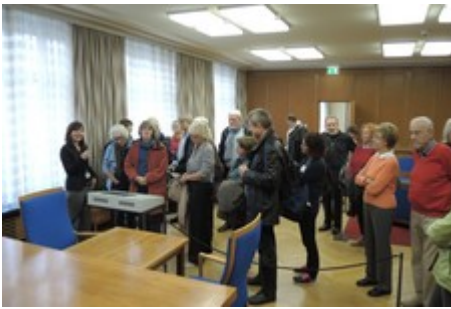
Originaleinrichtung aus den 1960ern