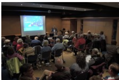
Vortrag von Kordula Schulz- Asche, MdB, zum Thema »Ja zu Europa!«