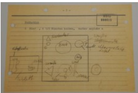
Frühstücksplan für Herrn Mielke