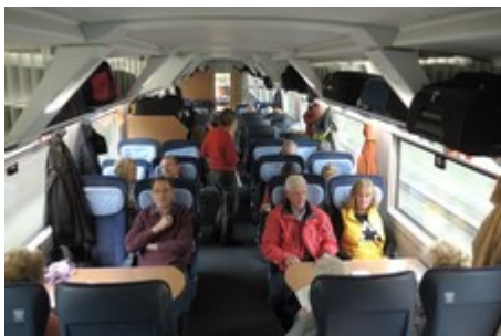
Im ICE auf der Fahrt nach Berlin

08:45 Uhr Treffpunkt im Frankfurter Hauptbahnhof (Abfahrt ICE 374 um 09:13 Uhr) 13:28 Uhr Ankunft mit der Deutschen Bahn AG Berlin-Hauptbahnhof. 14:00 Uhr Stadtrundfahrt durch die Bundeshauptstadt (Teil 1) 15:30 Uhr Informationsgespräch in der Bundeszentrale für politische Bildung 18:00 Uhr Check-in Hotel (Holiday Inn Berlin City East) 19:00 Uhr Abendessen