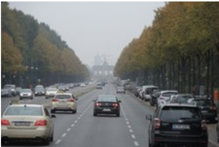
Straße des 17. Juni mit Blick aufs Brandenburger Tor