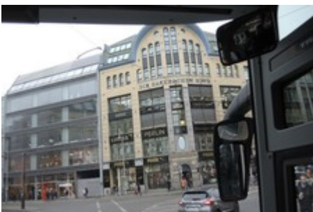
vorbei an den Hackeschen Höfen