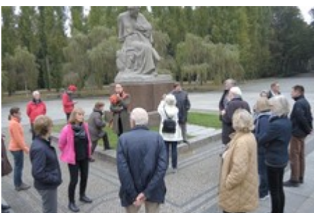
Gedenkstätte im Treptower Park