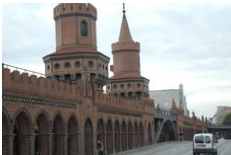
Oberbaumbrücke zwischen Kreuzberg und Friedrichshain