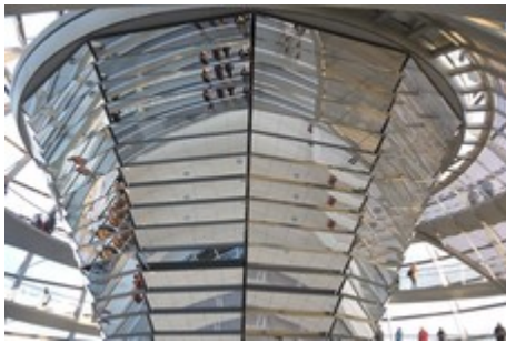
Spiegelungen im Klima-Trichter