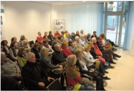
Informationsgespräch im Bundesgesundheitsmuseum