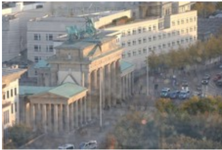
Blick aufs Brandenburger Tor