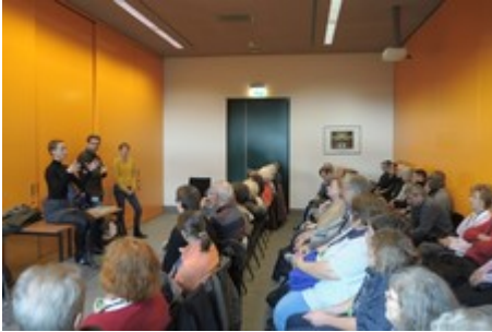
Gespräch mit Mitarbeiterinnen von Kordula Schulz-Asche über die Arbeit im Bundestag