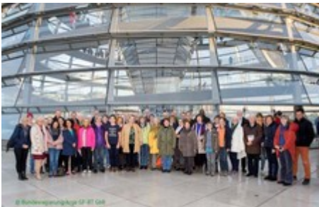
Gruppenbild auf der Besucherterrasse des Reichstagsgebäudes