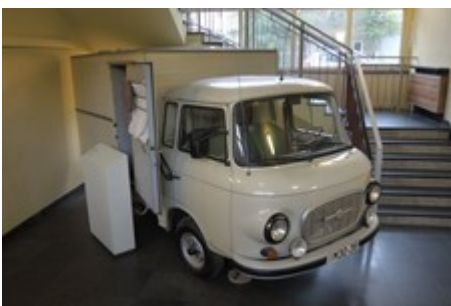
Gefangenentransporter (fünf Einzelzellen)