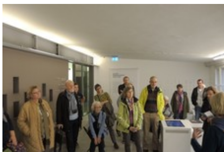
Führung im Dokumentationszentrum NS- Zwangsarbeit in Berlin- Schönweide