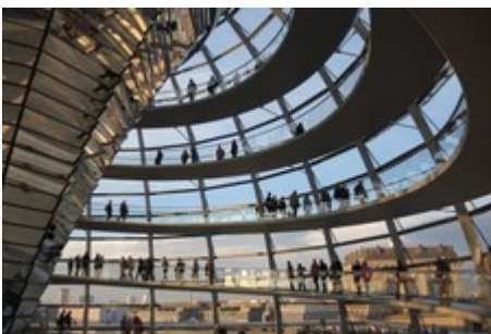
Die Kuppel des Reichstagsgebäudes im Sonnenschein