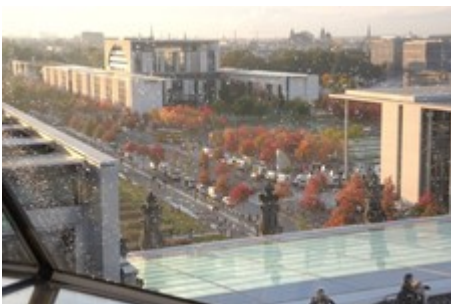
Blick aufs Bundeskanzleramt mit herbstlicher Färbung der Bäume