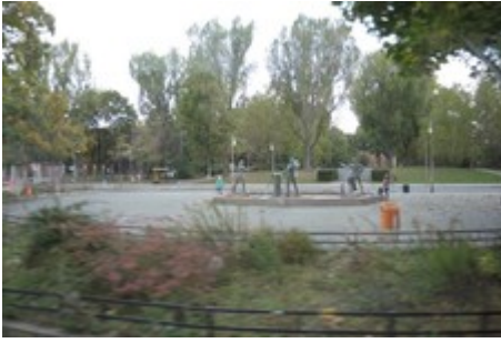
Feuerwehrbrunnen auf dem Mariannenplatz in Berlin- Kreuzberg