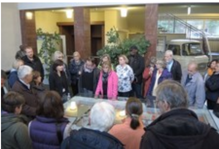
Führung im Stasi-Museum (Normannenstraße)