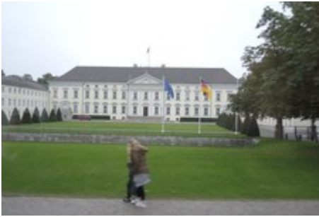
Schloss Bellevue, Sitz des Bundespräsidenten