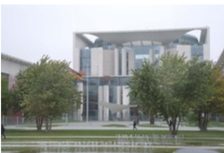
Blick aufs Bundeskanzleramt